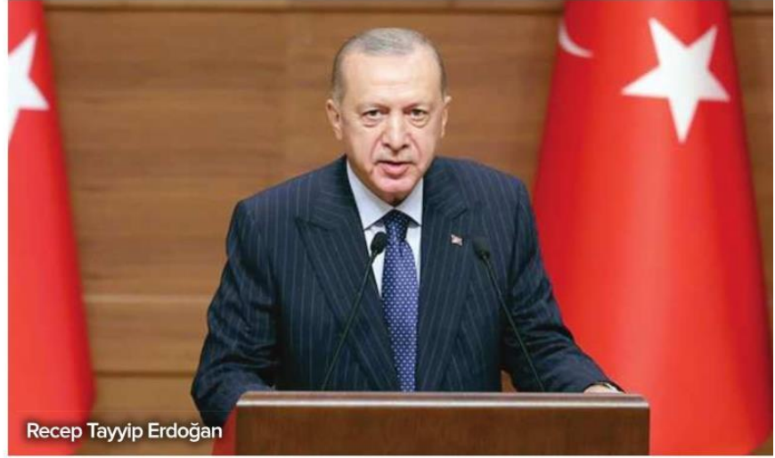
Recep Tayyip Erdoğan

Bunca zamandır faizlerin yükseltilmesinden başka tek bir çözüm teklifi sunamayanların, Türkiye'yi de dünyayı da doğru okuyamadıklarının ortada olduğunu ifade eden Erdoğan, sözlerini şöyle sürdürdü: "Amerika'ya, tüm Batı'ya baksınlar. Şu anda onların faiz politikaları nasıl çalışıyor, onu izlesinler. Çin'e, Hindistan'a baksınlar. Onların faiz politikaları nasıl çalışıyor, onu görsünler. Görecekler ki Amerika başta ol-